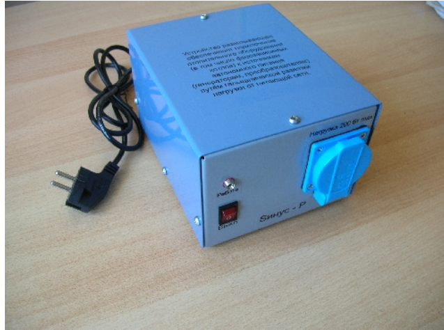
S - :